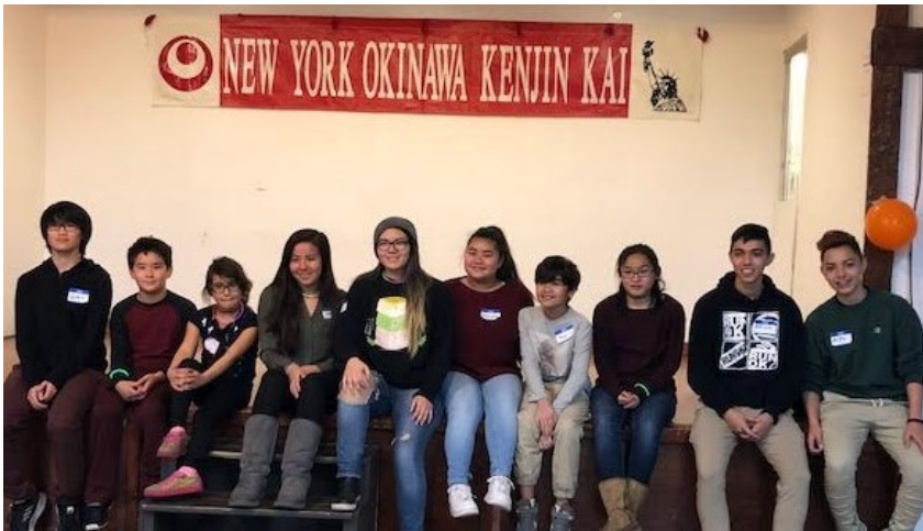
Future Generations of the OAANY